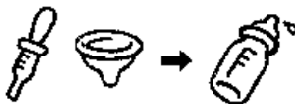
少量のミルクで溶かして おいしいミルクをたっぷり

1 回分のミルクにまぜると、全部飲まなかったりミルクがらいいなったりしますので、少量のミルクに溶かしてぐすりを与え、それからおいしいミルクを与えます。