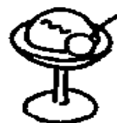
ぐすりのシャーベット